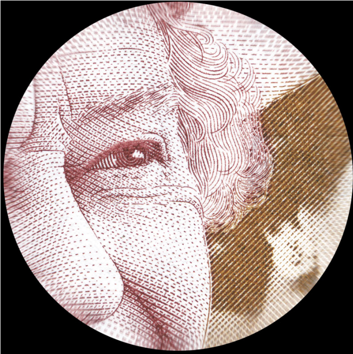
Увеличение фрагмента исследуемого объекта